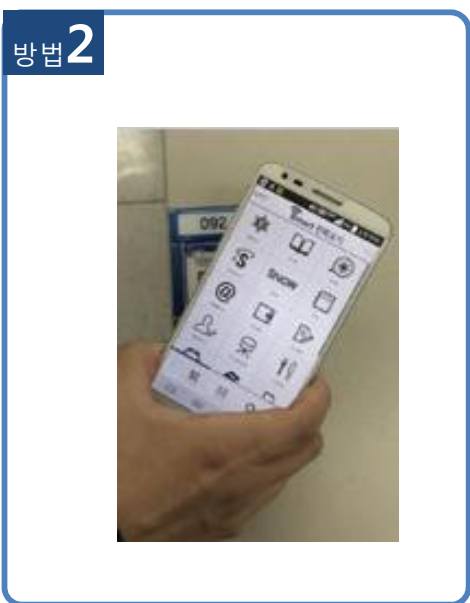
NFC 태그인식 (안드로이드만 가능)