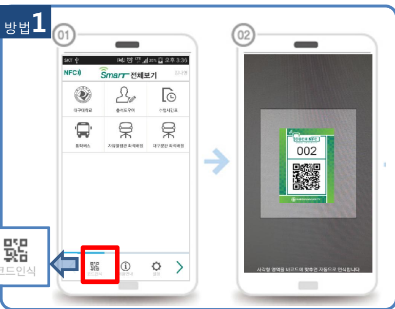
스마트 DU 앱 하단 [코드인식] 을 확인